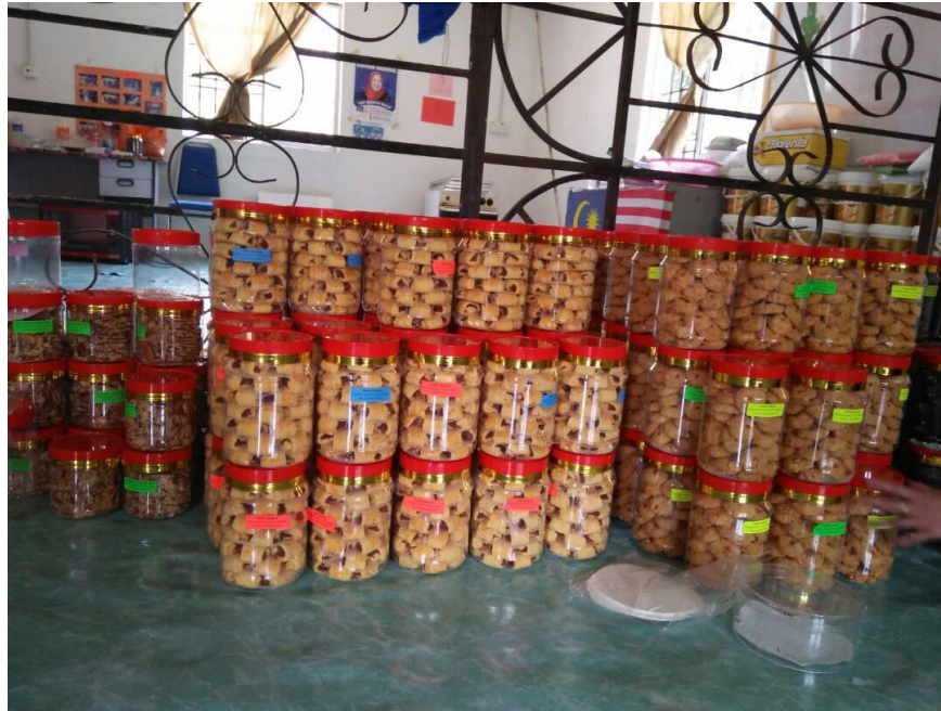
Caption : Balang Kuih Raya Bersticker yang dibuat oleh Zaini Mat Salleh