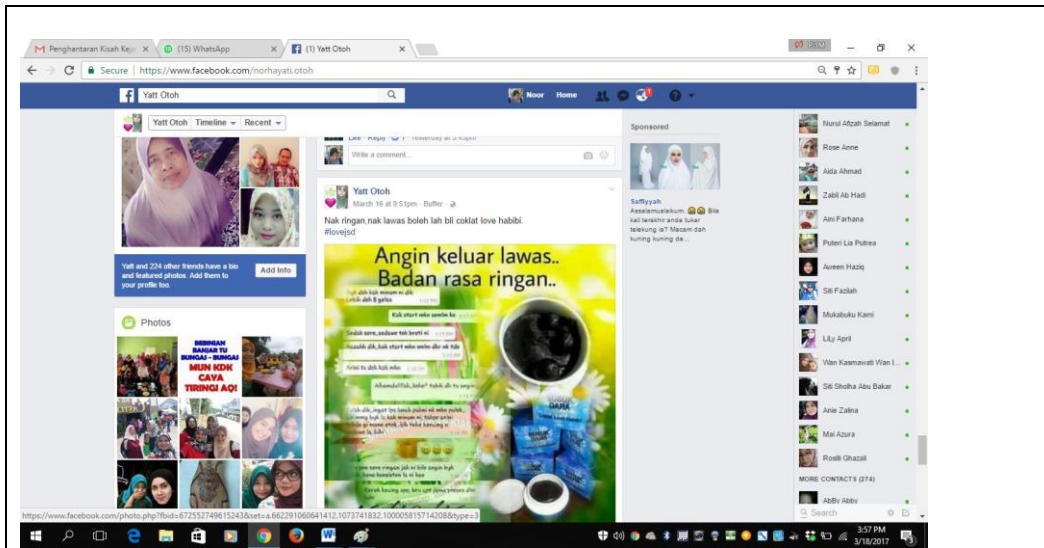
Caption : Iklan Di Facebook