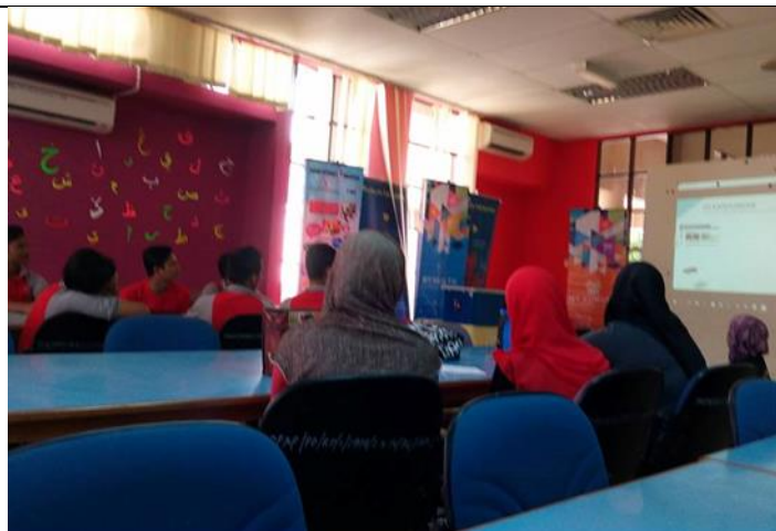
Pelajar Giat mara Sedang mendengar taklimat

Photo caption names Keterangan gambar beserta nama