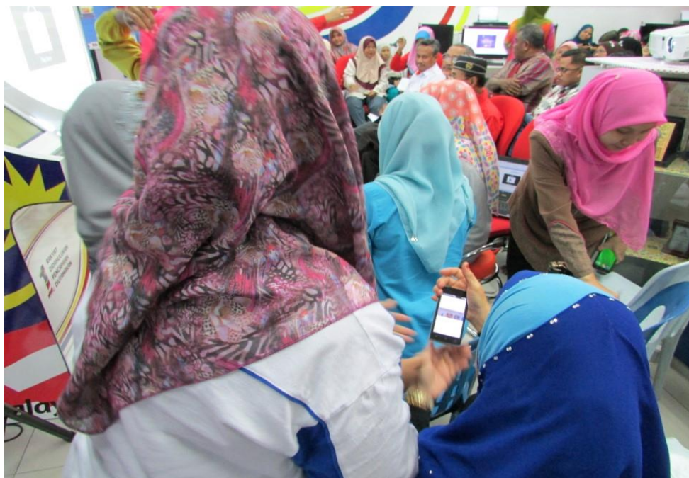
Mengajar cara-cara Install Aplikasi MALAYSIA4ALL