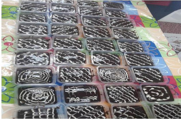
Kek Cheese Berhantu