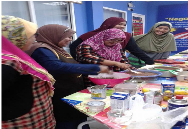
Cikgu sedang mengajar cara-cara membuat Kek Cheese Berhantu.