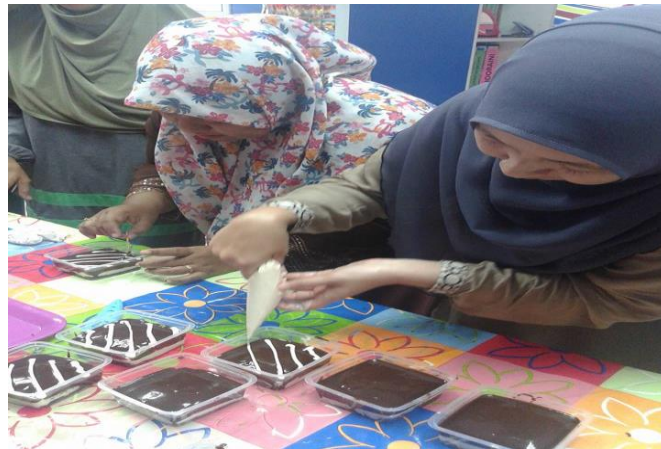
Cara melorek atau membuat hiasan pada kek.